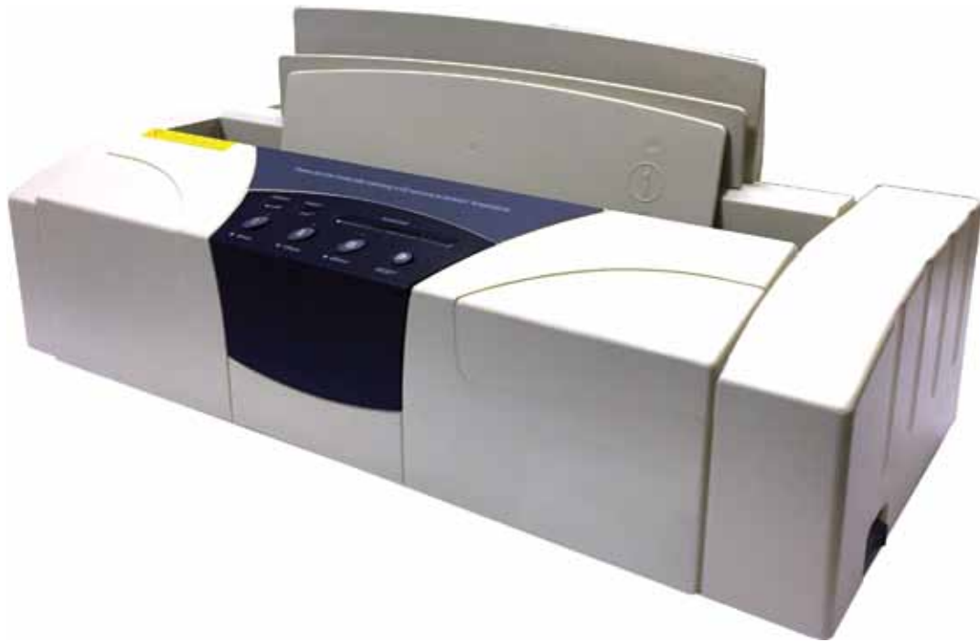
АВТОМАТИЧЕСКИЙ ТЕРМОПЕРЕПЛЕТЧИК OFFICE KIT TB400